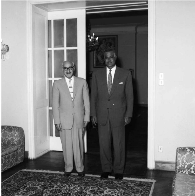
استقبال الزعيم العراقي رشيد عالي الكيلاني ١٩٥٨/٨/٣١